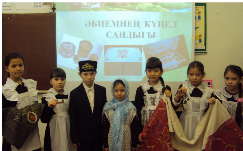
“Әбиемнең күңел сандыгы” темасына сыйныф сәгате үткәрдек. Сыйныф сәгатенә эзерлек барышында без борынғы бизәнү әйберләре , милли киёмнәр, һөнәрләр турында бай материал тупладык.