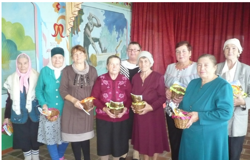
Безнең өчен бик кадерле һәм изге кешеләр.